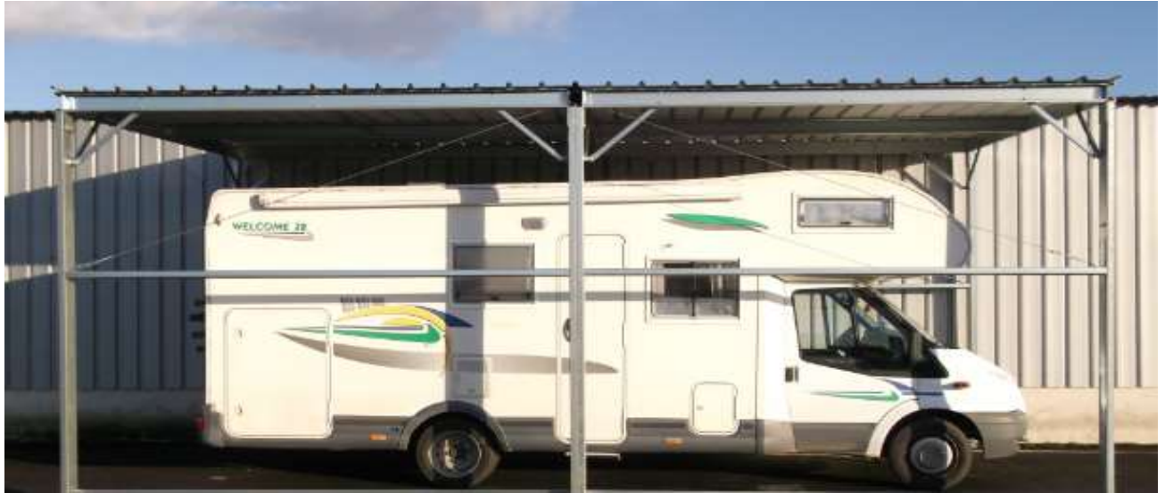
largeur 4,05 - longueur 8m hauteur mini 3,1m hauteur maxi 3,3m ( 2 modules de longueur 4m)